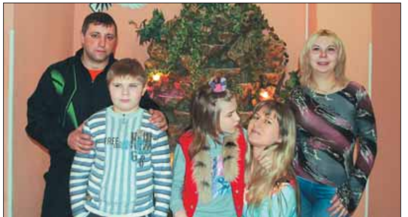
Клуб родителей, воспитывающих детей-инвалидов, работает в ЦСО «Восточное Измайлово».