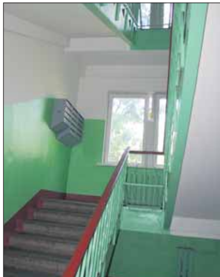
Сиреневый бульвар, д. 40 корп. 1

Здесь были выполнены работы по побелке потолков и покраске стен в едином тоне, ремонту оконных рам, почтовых ящиков, созданию соответствующего утеплительного контура, приведению в порядок входных групп, замене светильников, уборке слаботочной проводки в коробах.