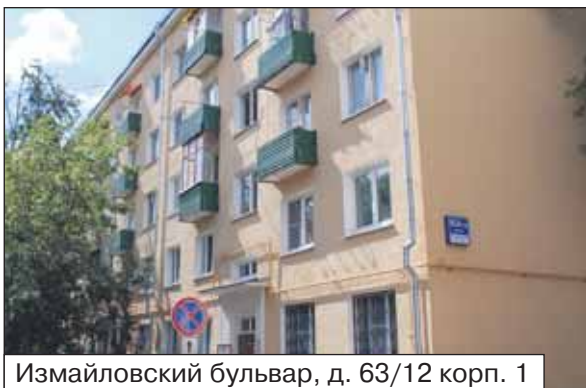
Измайловский бульвар, д. 63/12 корп. 1

Самое главное – мы были в постоянном контакте и с нашей управляющей организацией ГУП ДЕЗ, и с подрядчиками. Если что не так, то сразу встречались, обсуждали проблемы и принимали меры.