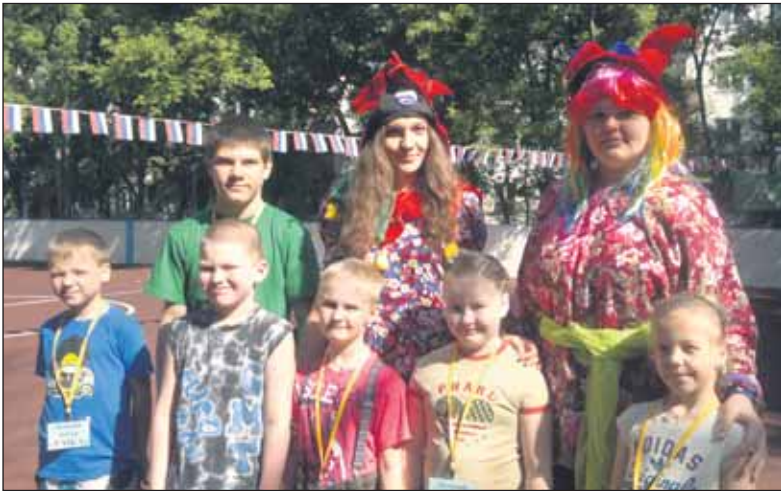
Как обычно, в течение всего лета двери детского Центра развития ребенка «Умка» были открыты для жителей района Восточное Измайлово всех возрастов.