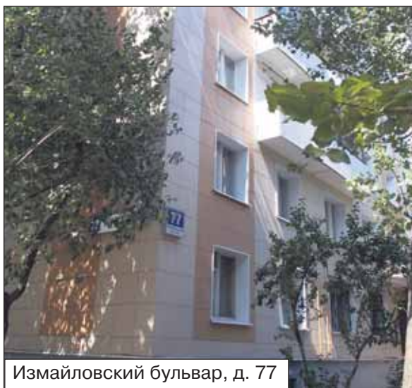
Измайловский бульвар, д. 77

В доме 63/12 корп. 1 заменили трубопроводы горячего и холодного водоснабжения, центрального отопления с отопи-