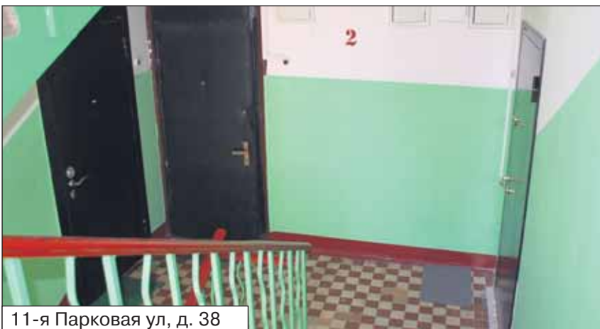
11-я Парковая ул, д. 38