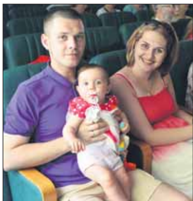
Добрый яркий окружной праздник в честь Дня семьи, любви и верности состоялся в ПВТ № 19.

Организовали и провели праздник Центр развития ребенка «Умка», администрация ПВТ № 19, управа района Восточное Измайлово, Дом общественных организаций ВАО, ТЦСО «Восточное Измайлово», ЭТК № 22.